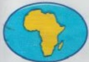
قارة إفريقيا Africa