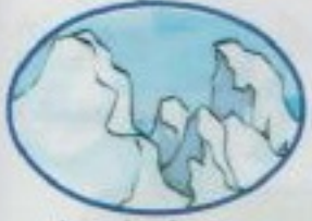
المنطقة القطبية الشمالية north pole