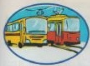
وسائل مواصلات transport